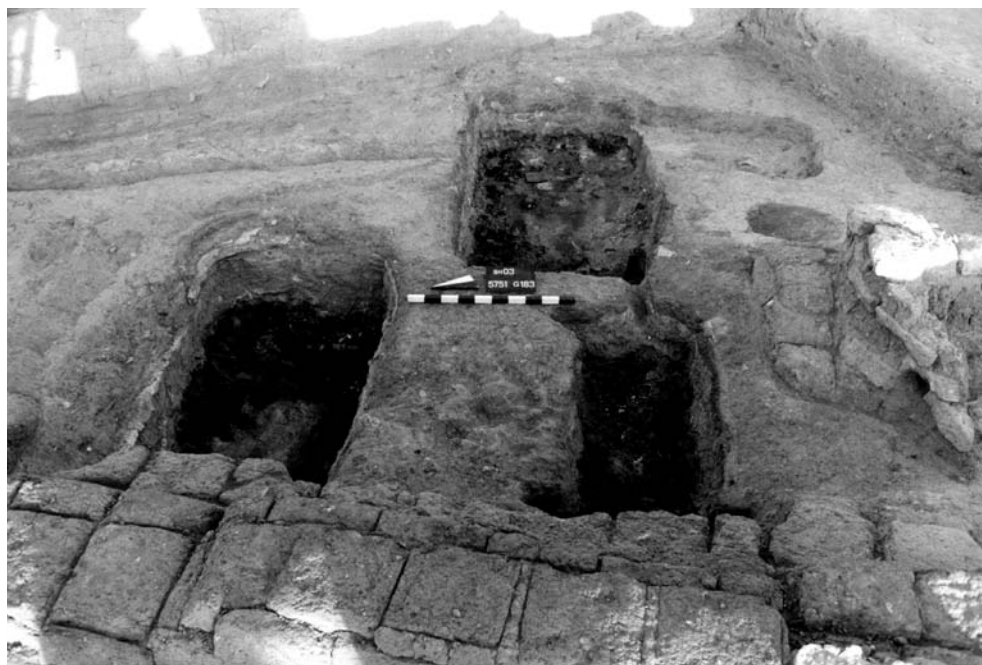
Abb. 10: Brandgrubengräber 03/03, 03/04 und 03/26