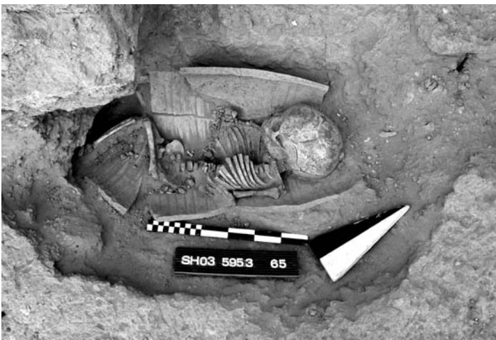
Abb. 3: Topfgrub 03/13 mit Körperbestattung