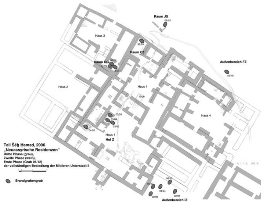
Abb. 8: Plan der Neassyrischen Residenzen mit Brandgrabengräbern