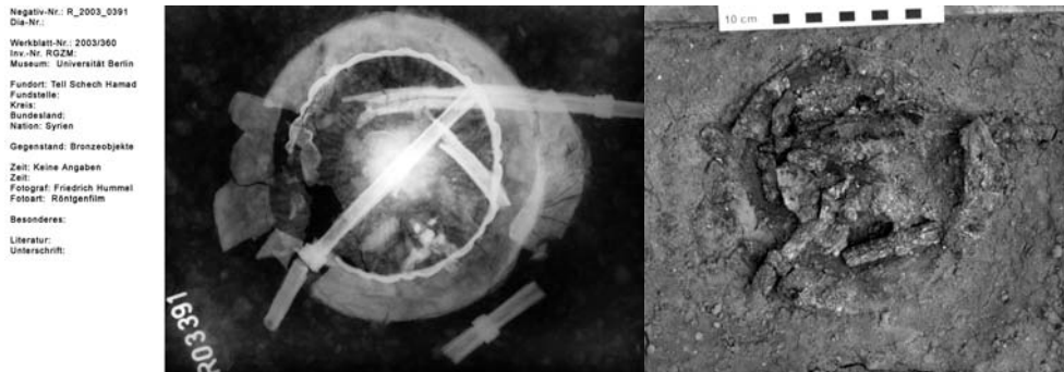
Abb. 11: Bronzeschale mit Trinkhalmen aus Grab 03/26: a) Röntgenaufnahme, b) Aufsicht der Blockbergung