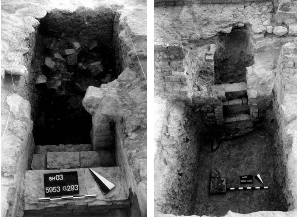
Abb. 1-2: Antik gestörte Gruft 03/28 aus gebrannten Ziegeln