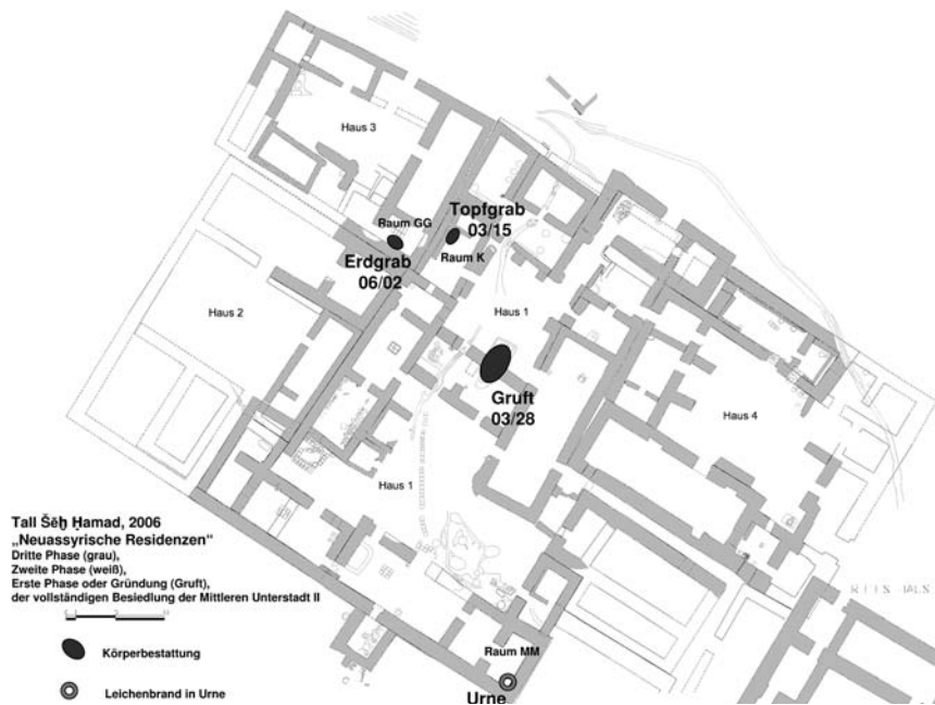
Abb. 7: Plan der Neassyrischen Residenzen mit Bestattungen, deren Typ von Vergleichsfundorten bereits bekannt ist